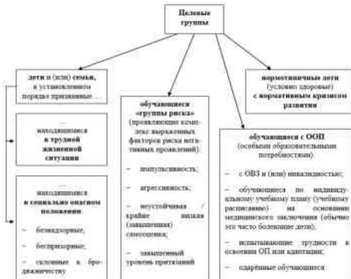
Рисунок 2 – Целевые группы обучающихся МДОУ ЦРР–д/с №15

КРР с обучающимися целевых групп осуществляется в ходе всего образовательного процесса, во всех видах и формах деятельности, как в совместной деятельности детей в условиях дошкольной группы, так и в форме коррекционно-развивающих групповых/индивидуальных занятий.