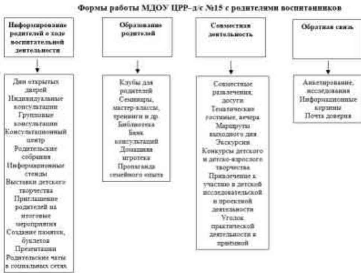
Рисунок 5 – Формы работы педагогов МДОУ ЦРР-д/с №15 с родителями воспитанников

С этой целью в МДОУ ЦРР-д/с №15 используются различные формы взаимодействия с семьей.