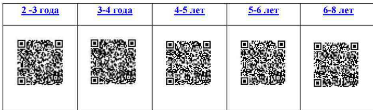
Таблица 19 – Ссылки на перечни