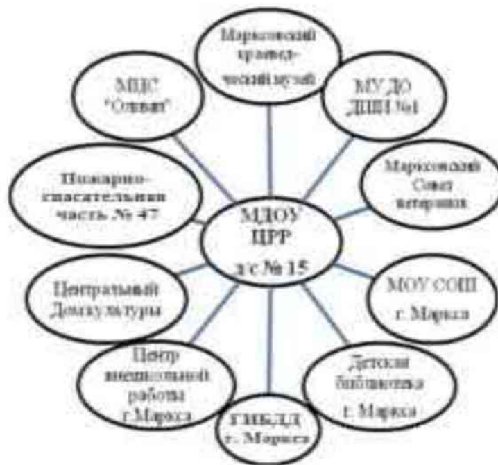
Рисунок 6 – Модель социального партнерства МДОУ ЦРР–д/с № 15

Данная модель реализуется через Программу сетевого взаимодействия и является вариативной составляющей Программы воспитания МДОУ ЦРР–д/с №15 http://mdoucrr-ds15.ucoz.ru/index/vospitatelnaja_rabota/0-174