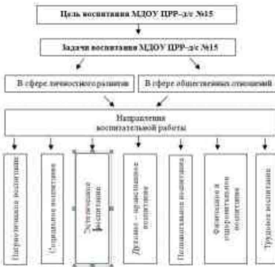
Рисунок 3 – Направления воспитательной работы в МДОУ ЦРР-д/с №15

Целевые ориентиры воспитания дошкольников (п.4.1. ФГОС ДО) представляют собой социально-нормативные возрастные характеристики возможных достижений ребенка на этапе завершения уровня дошкольного образования.