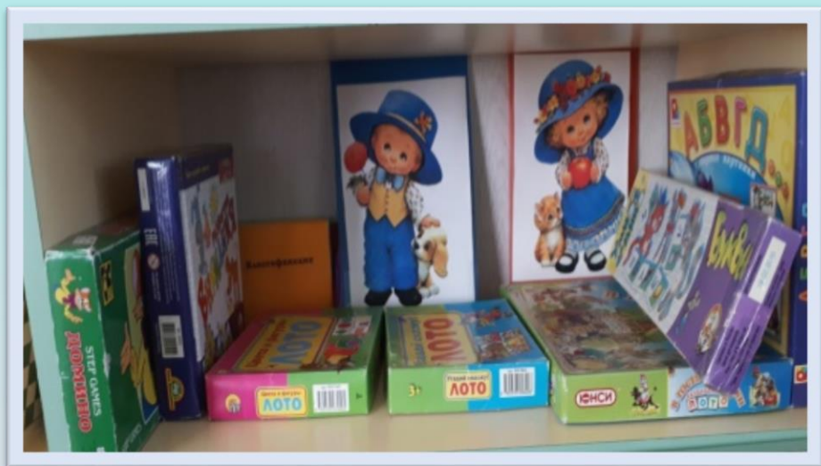
Центр социально-коммуникативного развития